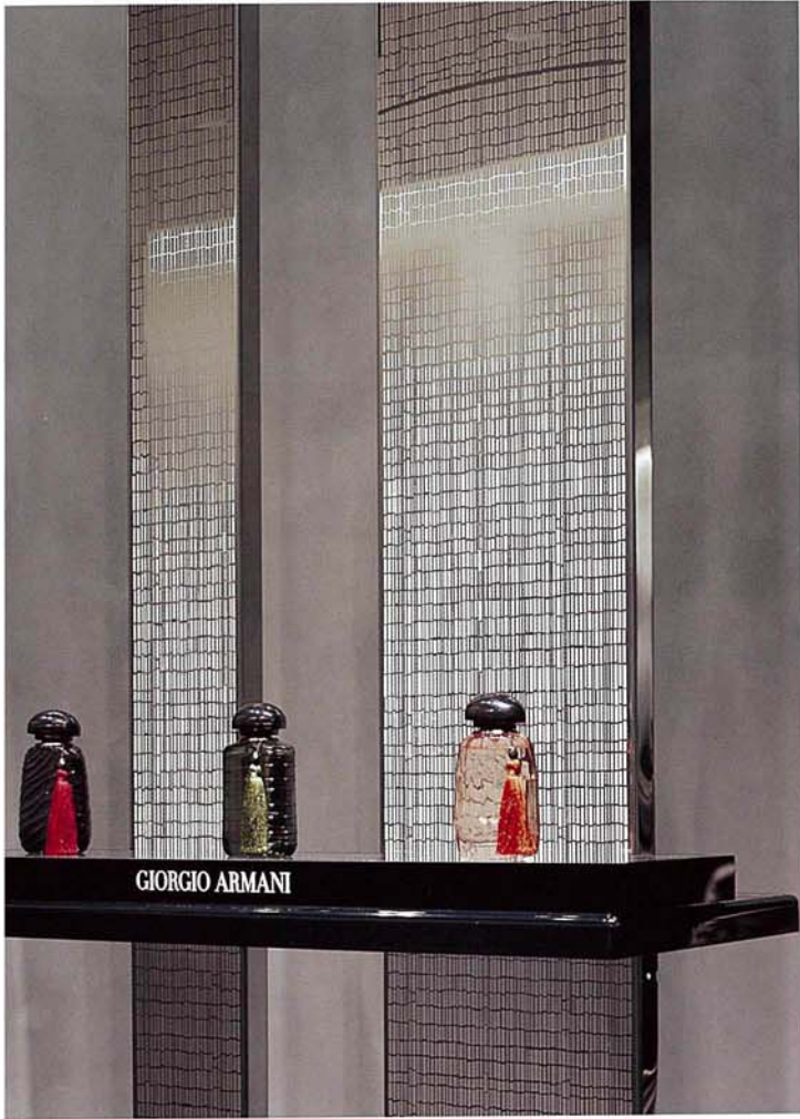
透明アクリルの棚板は、バンブーのみに固定されている