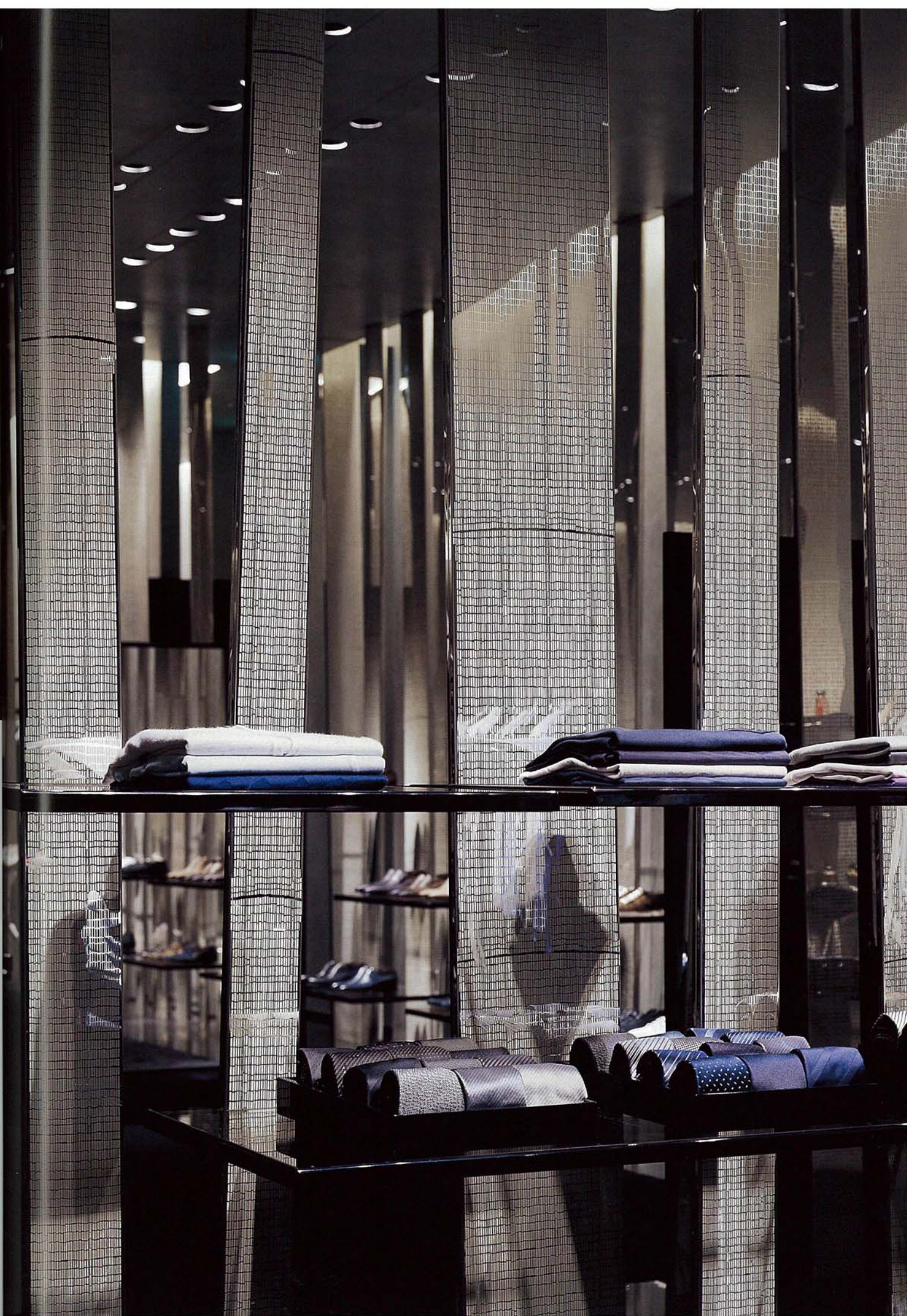
前頁/レディースエリア。“バンパー”スクリーン奥の壁面は、密に配したウォールウォッシャーが強く照らし出す。上/オーダーにも対応するメンズのVIPルーム。右/メインエントランスからメンズエリアを見る。バンパーの奥にも売り場が連続する。右頁/ステンレス鏡面仕上げのバンパーには、表面にシルクプリントが施されている。